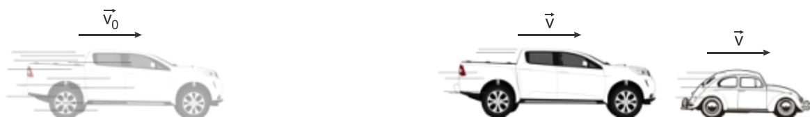
Camionete desacelerando para não colidir com o Fusca.

3. (Ufjf-pism 1 2019) O sistema de freios ABS ( Anti-lock Braking System ) aumenta a segurança dos veículos, fazendo com que as rodas não travem e continuem girando, evitando que os pneus derrapem. Uma caminhonete equipada com esse sistema de freios encontra-se acima da velocidade máxima de 110 km/h permitida num trecho de uma rodovia. O motorista dessa caminhonete avista um Fusca que se move no mesmo sentido que ele, a uma velocidade constante de módulo v = 108 \text{ km/h} , num longo trecho plano e retilíneo da rodovia, como mostra a Figura. Ele percebe que não é possível ultrapassar o Fusca, já que um ônibus está vindo na outra pista. Então, ele imediatamente pisa no freio, fazendo com que a caminhonete diminua sua velocidade a uma razão de 14,4 km/h por segundo. Após 5 s, depois de acionar os freios, a caminhonete atinge a mesma velocidade do automóvel, evitando uma possível colisão.